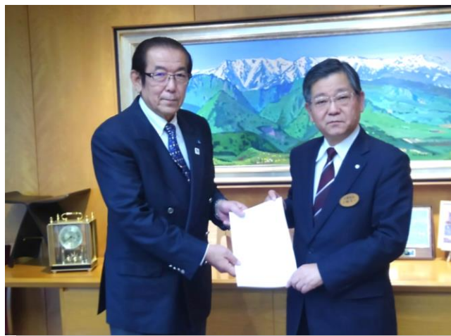
▲左から 鈴木副会長 仁科町長