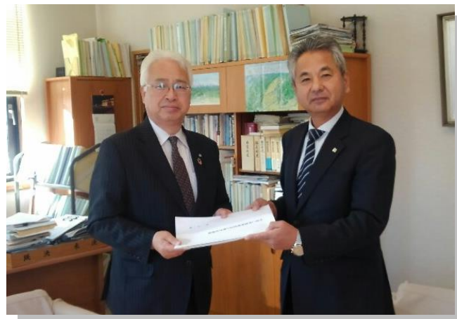
▲左から 後藤町長 堀江副会長