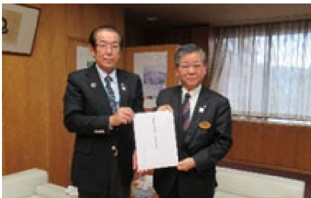
▲左から 鈴木副会長 仁科町長