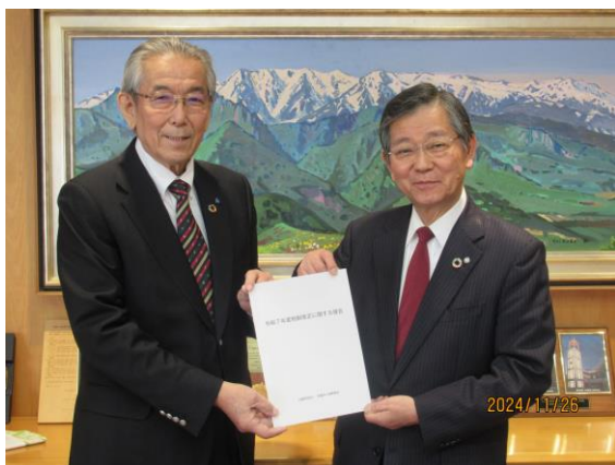
▲写真左から 鈴木副会長 仁科町長